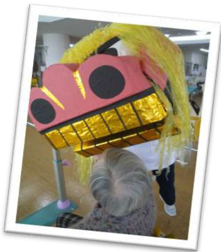
ご利用者の邪気を払う当施設の獅子

本年もフットワーク軽く、様々なことに興味を持って取り組んでいきます。目の前の対象者のために、そして地域高齢者のために、お互い頑張りましょう！ 令和6年1月機能訓練室職員一同